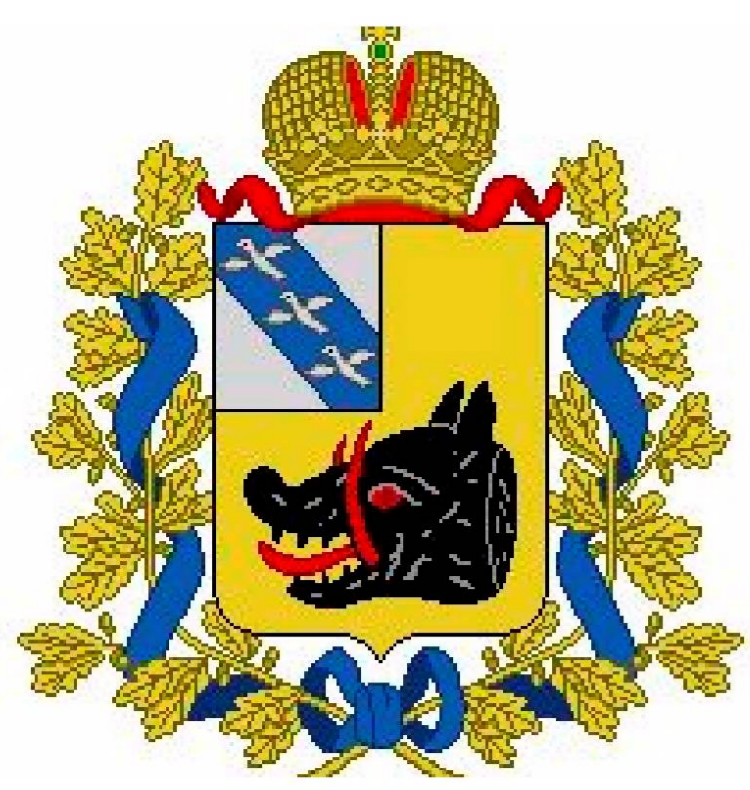
Схема градостроительного зонирования территории муниципального образования "Никольниковский сельсовет" Рыльского района Курской области

УТВЕРЖДЕНО решением Собрания депутатов Никольниковского сельсовета Рыльского района Курской области от _____ 2019 года № _____